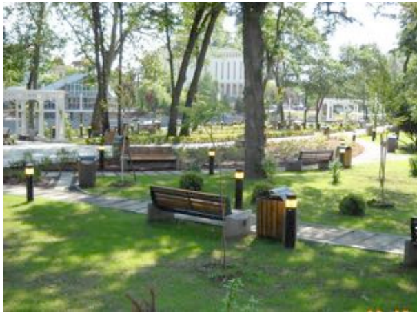
„Reamenajare zonă de agrement Pădurice”