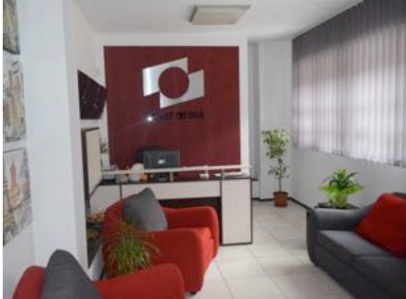
„Dezvoltarea capacității în mass-media din Banat”