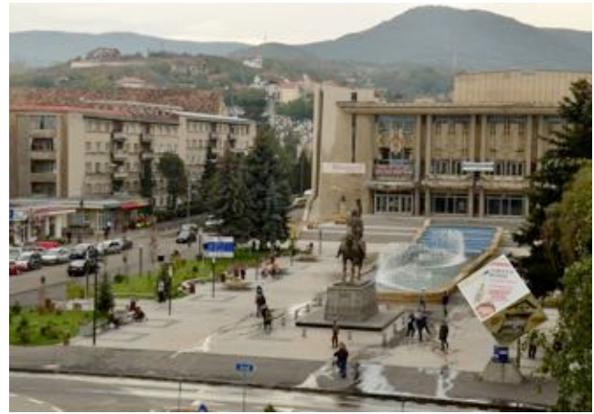
„Amenajare Piața Victoriei din Municipiul Deva”