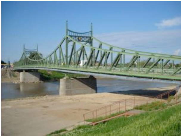
„Reabilitarea Centrului Istoric Vechi al Municipiului Arad”