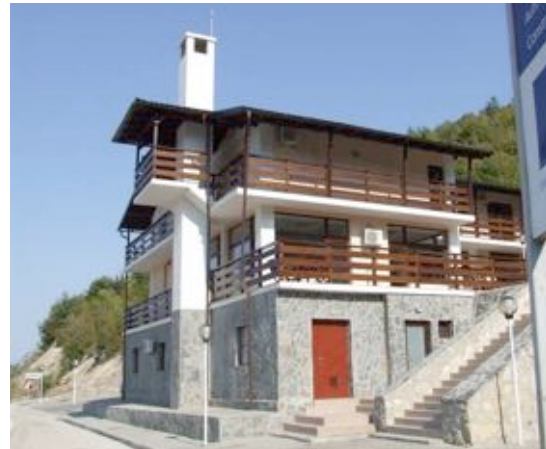
„Campus Universitar de Vara”

Beneficiar: Universitatea "Eftimie Murgu" Reșița