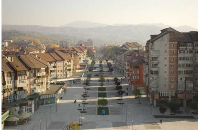
„Reabilitare zonă pietonală și parcuri în centrul municipiului Petroșani”