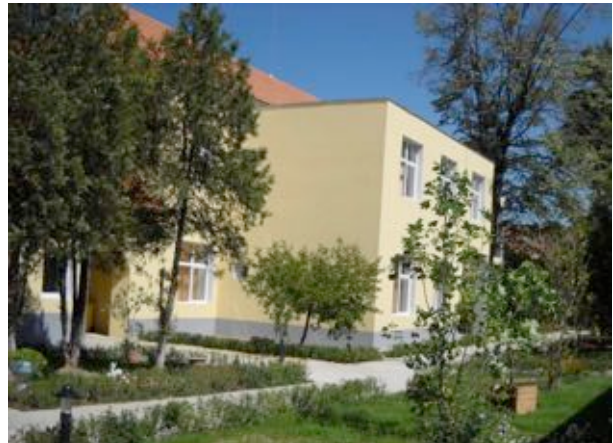
„Reabilitarea și extinderea Centrului de Îngrijire și Asistență Pecica”

Beneficiar: Direcția Generală de Asistență Socială și Protecția Copilului Arad