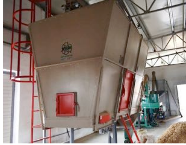
„Fabrică de ecopellets”