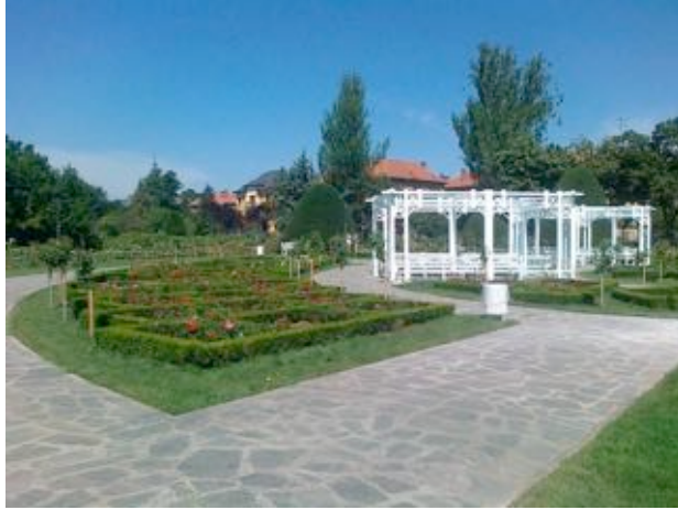
„Modernizarea Parcului Rozelor din Municipiul Timișoara”

Beneficiar: Consiliul Județean Hunedoara