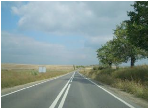
„Reabilitare drum județean DJ 592, Buziaș – Lugoj, km 25+000-54+200, L= 29,2 km”