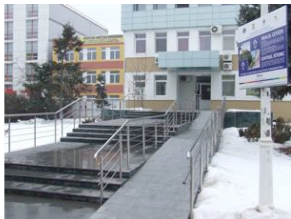
„Ambulatoriu integrat din cadrul Spitalului Județean de Urgență Deva - modernizarea și echiparea cu aparatură de specialitate”