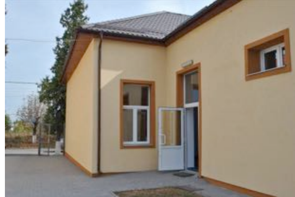
“Modernizare Școala Generală O.V. Călan și Școala Generală Strada Unirii – Corpuri de Clădire A și B”