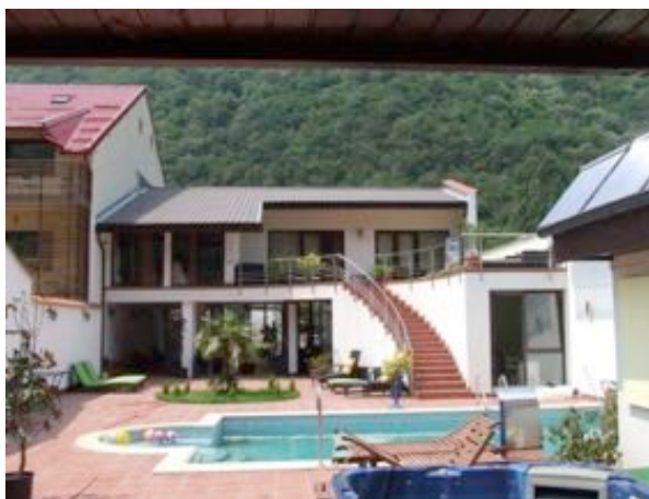
“Înființarea unui centru SPA în Băile Herculane”