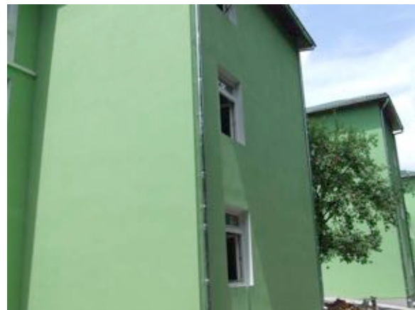
“Reabilitarea și modernizarea azilului de bătrâni Reșița”

Beneficiar: Consiliul Județean Caraș-Severin