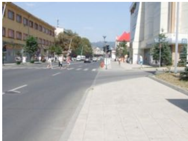
“Reabilitarea și modernizarea arterei principale din Municipiul Petroșani”