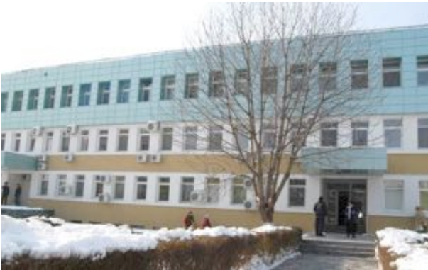
”Ambulatoriu integrat din cadrul spitalului Județean de Urgență Deva modernizarea și echiparea cu aparatură de specialitate”

Beneficiar: Universitatea "Eftimie Murgu" Reșița