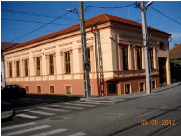
“Reabilitarea Centrului Istoric Vechi al Municipiului Arad”