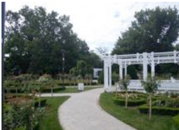
“Modernizarea Parcului Rozelor din Municipiul Timișoara”