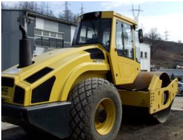
”Achiziție de utilaje la SC Polmar Construct Serv SRL din Municipiul Reșița”

Beneficiar: Casa de Ajutor Reciproc a Pensionarilor Deva