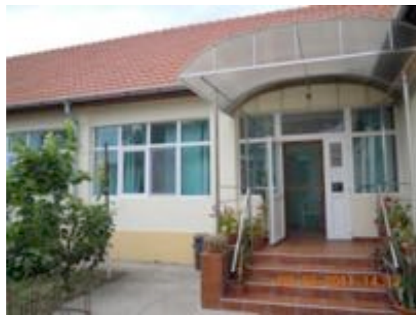
”Reabilitarea și modernizarea căminului pentru persoane vârstnice din Jimbolia”

Beneficiar: SC Polmar Construct-Serv SRL