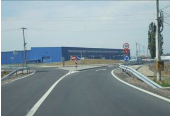
”Centura Nord-Vest de ocolire a oraşului Buziaş, L=4.3 km”

Beneficiar: Consiliul Judeţean Timiş în Parteneriat cu Consiliul Local Buziaş