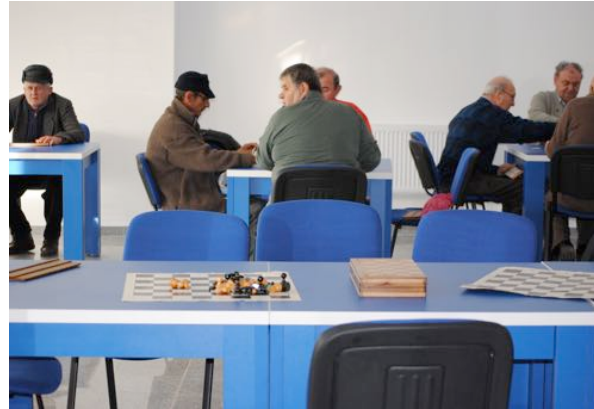
” Modernizare și extindere centru social pentru persoane vârstnice CARP Deva”

Beneficiar: Consiliul Judeţean Timiş în Parteneriat cu Consiliul Local Buziaş