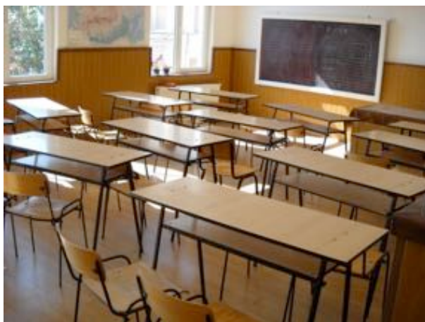
“Extindere și modernizare școala generală Ioan Slavici Șiria”