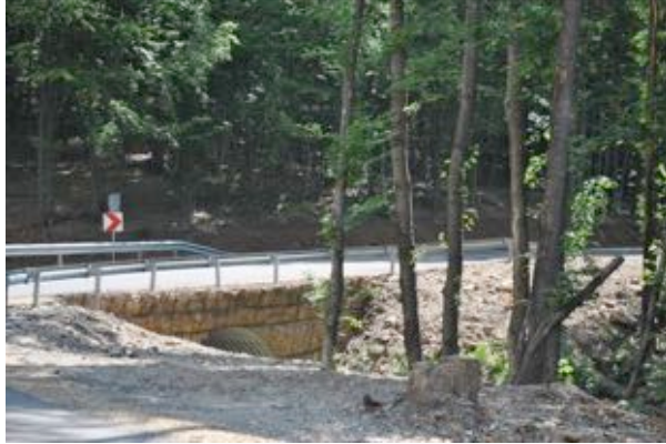
“Modernizare tronson Julița - Mădrigești, Componentă a traseului turistic E68 Moneasa”