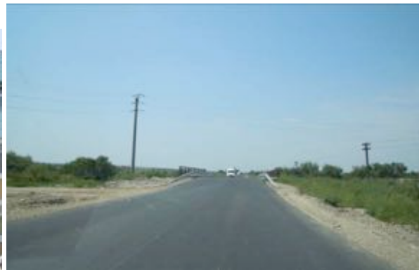
“Reabilitare drum județean DJ 592, Buziaș – Lugoj, km 25+000-54+200, L= 29,2 km”

Beneficiar: Consiliul Județean Hunedoara