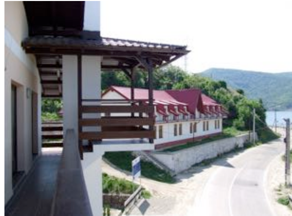
“Campus Universitar de Vara”

Beneficiar: Universitatea "Eftimie Murgu" Reșița