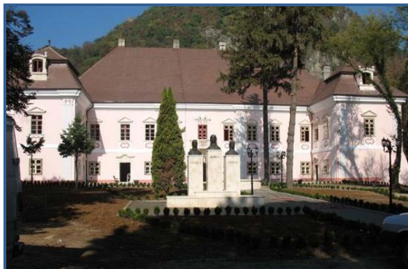
Consolidare - restaurare „Castel Bethlen Magna Curia Deva”

Beneficiar: Consiliul Județean Hunedoara