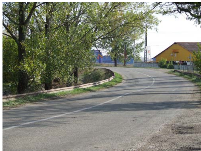
„Centura Nord - Vest de ocolire a orașului Buziaș, L=4,3 km”

Beneficiar: Consiliul Local al Municipiului Arad