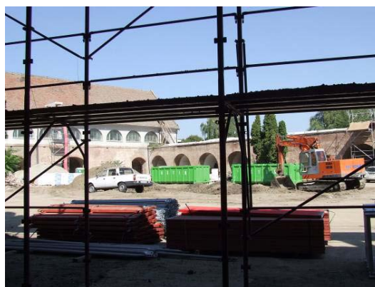
„Reabilitarea și revitalizarea Cetății Timișoara - Bastionul”

Beneficiari: Consiliul Local Moneasa și Consiliul Județean Arad