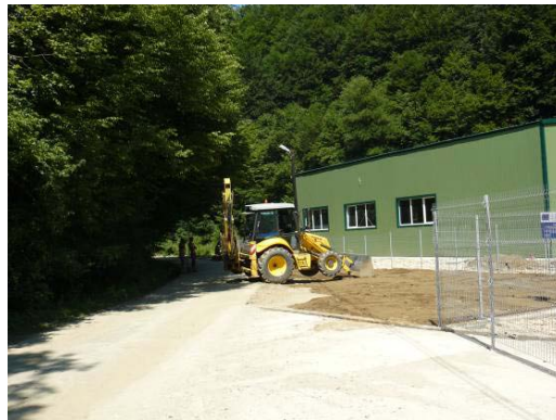
„Sistem de gestionare a deșeurilor în zona turistică Semenice”

Beneficiar: Consiliul Județean Hunedoara