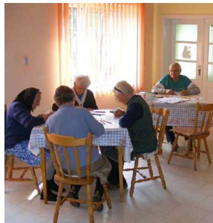
„Reabilitarea și modernizarea căminului pentru persoane vârstnice din Jimbolia”

Beneficiar: Consiliul Local al Orașului Petrița