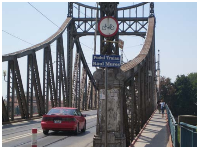
„Reabilitarea Centrului Istoric Vechi al Municipiului Arad”

Beneficiar: Consiliul Local al Municipiului Arad