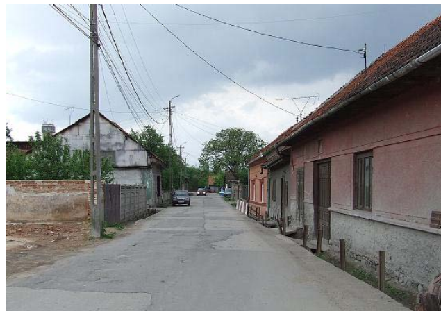
„Modernizare (Ranforsare) strada Republicii - Cimpa din orașul Petrița”

Beneficiar: Consiliul Local al Orașului Petrița