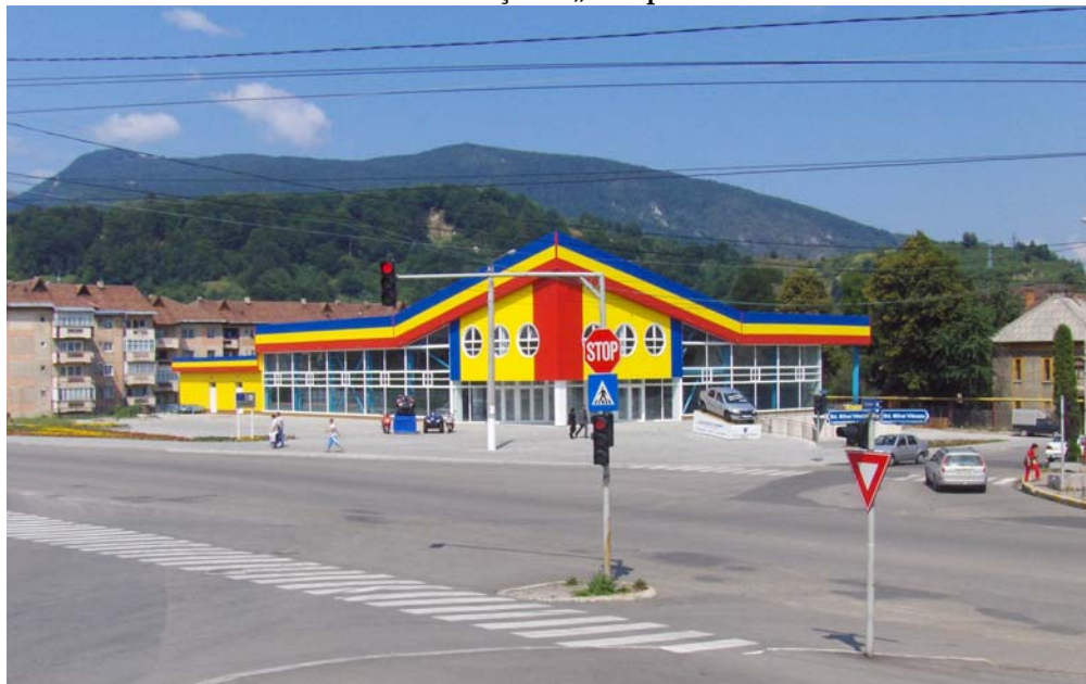
Programul Phare 2001 Coeziune Economică și Socială, Componenta Investiții - Infrastructură Mică - Consiliul Local Vulcan - „Complex Proeuropa”

Cel de-al VIII-lea proiect - „Modernizare DJ 664A: Lupeni - zona de agrement Straja km 1+000-9+300”, beneficiar Consiliul Județean Hunedoara este în curs de implementare, termenul de finalizare al lucrărilor fiind 30.09.2007.