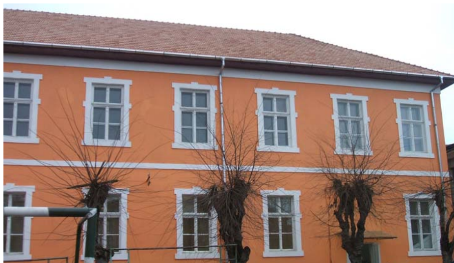
Programul PHARE 2003 TVET - Grup Școlar Nicolaus Olahus Orăștie

Programul a avut ca termen de finalizare sfârșitul lunii august 2006. Din motive obiective termenul de finalizare a fost prelungit, diferențiat pe școli, pentru luna septembrie 2006 și apoi replanificat până în cursul lunii ianuarie 2007.