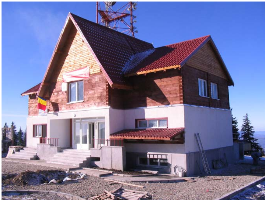
Programul Phare 2001 Coeziune Economică și Socială, Componenta Investiții –

Pentru patru proiecte s-au întocmit, verificat și transmis Autorității Contractante - Ministerul Dezvoltării Lucrărilor Publice și Locuințelor, rapoartele finale, efectuându-se și două plăți finale. Un raport final este în verificare la ADR Vest iar două sunt în faza de întocmire de către beneficiari.